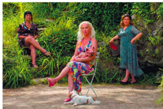
Nona edizione Alle 15.30, Working the woods di Lola Peuch (Francia | 2022 | 45 min)

zione di prodotti cinematografici locali e incentivare il lavoro dei giovani cineasti umbri. Quattro i titoli in programma al Meliès: U pisciatori carmu di Marlon Sartore (Italia, 2023, 19'); Cojocabron di Luca Draoli (Italia, 2021, 24'); Una storia vera di Greta Amadeo (Italia, 2023, 9'), I am the cosmos di Chiara Ortolani (Italia, 2022, 16'). Sempre domenica, alle 16.30, per il Per-