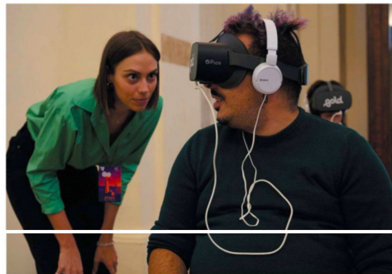
PerSo Film Festival Workshop e rassegna alla Sala Binini di Perugia

Cosa caratterizza i video in Realtà Virtuale e come usarli al meglio? I video VR ci permettono di esplorare la realtà a 360 gradi, proiettandoci al centro della scena. Il corso si propone di offrire strumenti teorici e pratici per padroneggiare le tecniche di realizzazione di video a 360°. Il lavoro teorico parte da una riflessione condivisa sulle tecnologie abilitanti, dai visori al