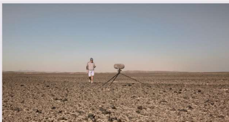
Wind | PerSo – Perugia Social Film Festival: 40 titoli, 7 anteprime italiane, 6 giorni di proiezioni, masterclass e il progetto

Parizad , di Mehdi Imani Shahmiri, Iran, 2020, 24'.