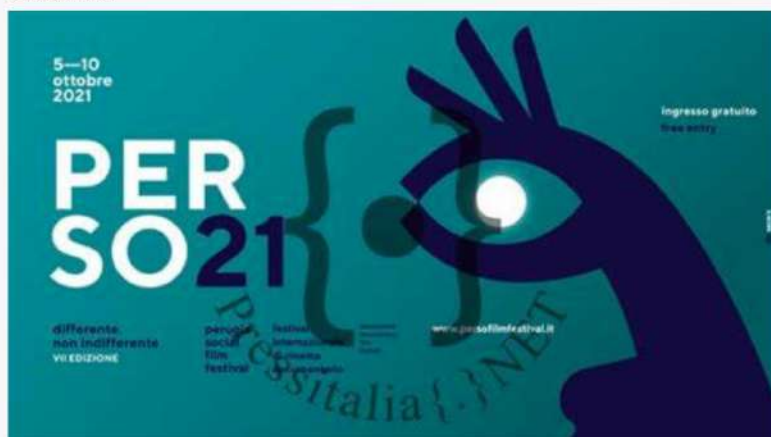
PerSo - Perugia Social Film Festival : dal 5 al 10 ottobre la VII edizione

Prime anticipazioni per la VII edizione del PerSo – Perugia Social Film Festival , in programma dal 5 al 10 ottobre. Sperimentazione e nuovi linguaggi nel cinema del reale, saranno al centro dell'evento internazionale, realizzato dall' associazione RealMente in collaborazione con la Fondazione La Città del Sole Onlus, sotto la direzione artistica di Luca Ferretti e Giovanni Piperno. Sei giorni di proiezioni in lingua originale con doppia sottotitolazione in italiano e inglese per un'edizione densa di appuntamenti per gli appassionati del cinema documentario e d'autore, ad ingresso gratuito nelle tre sale cinematografiche del centro di Perugia; oltre a questo, un progetto artistico nel suggestivo salone grande del MANU – Museo Archeologico Nazionale dell'Umbria.