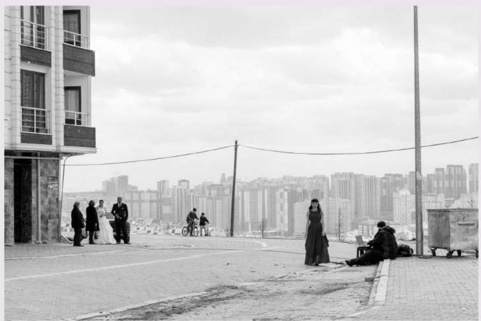
Letters from Sillivri | PerSo – Perugia Social Film Festival: 40 titoli, 7 anteprime italiane, 6 giorni di proiezioni, masterclass e il progetto Mascarilla 19