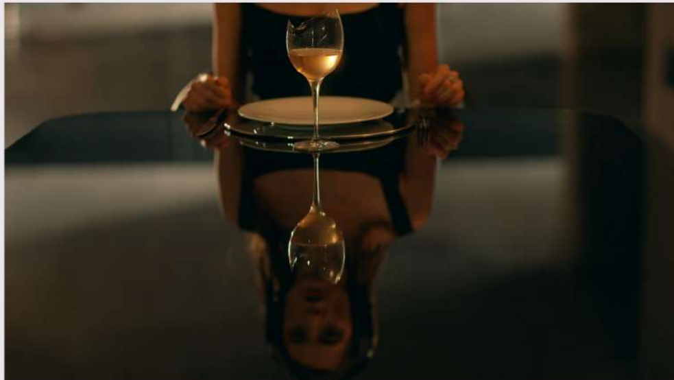
Masbedo | PerSo – Perugia Social Film Festival: 40 titoli, 7 anteprime italiane, 6 giorni di proiezioni, masterclass e il progetto Mascarilla 19

Progetto commissionato e prodotto da Fondazione In Between Art Film, fondata e presieduta da Beatrice Bulgari, che con il riferimento diretto a questa campagna ha voluto da un lato richiamare l'attenzione su un'emergenza globale, dall'altro dare uno stimolo agli artisti fornendo loro anche un sostegno concreto alla produzione di nuovi progetti quando tutte le produzioni artistiche risultavano sospese. Curatori del progetto: Leonardo Bigazzi, Alessandro Rabottini, Paola Ugolini.