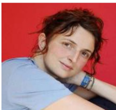
Matteo Garrone e Alice Rohrwacher sono protagonisti degli eventi di apertura e chiusura del Festival

Settima edizione da martedì 5 a domenica 10 ottobre