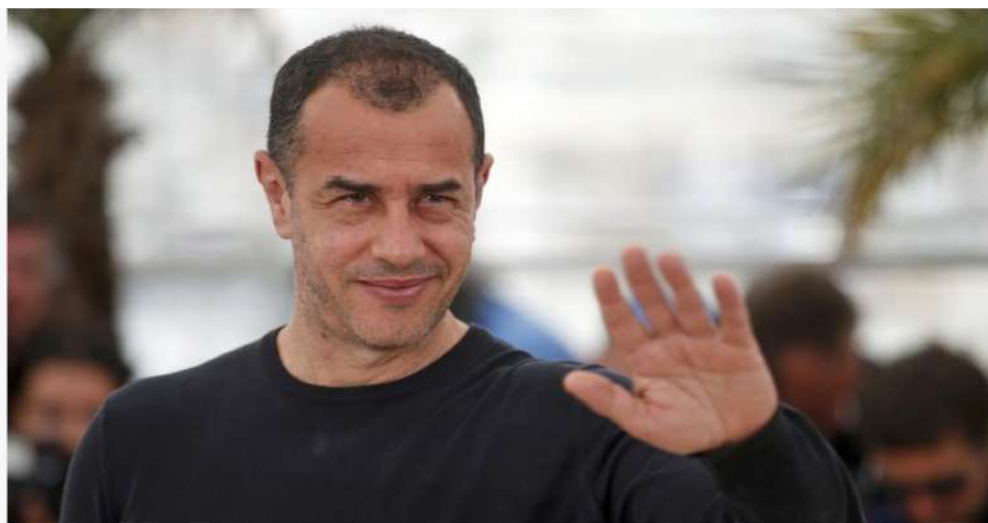
Il regista Matteo Garrone, protagonista dell'apertura della VII edizione del PerSo-Perugia Social Film Festival

Con un incontro che vede protagonista Matteo Garrone, prende avvio dal Cinema Zenith la settima edizione del PerSo – Perugia Social Film Festival .