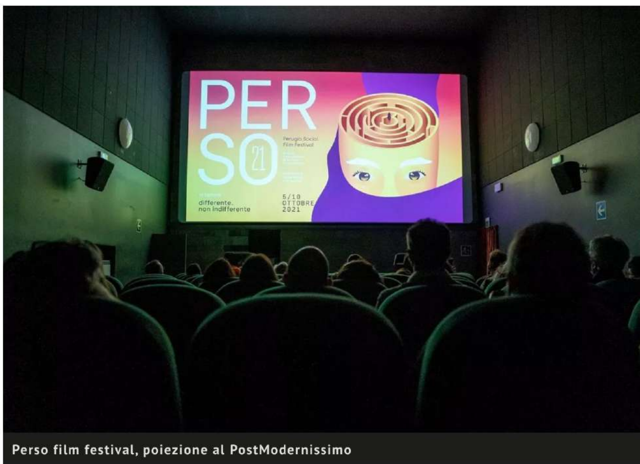
Perso film festival, proiezione al PostModernissimo

Chiusa l'ottava edizione del festival internazionale del cinema documentario. Sale piene e in sicurezza, organizzatori soddisfatti