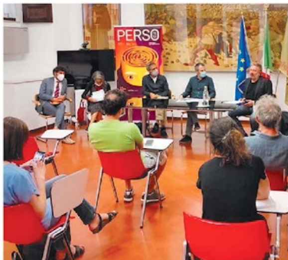
Cinema A Palazzo Donini è stato presentato il Perseo Festival edizione 2021

Sono questi i numeri dell'edizione 2021 del PerSo Festival, la manifestazione che si svolgerà a Perugia da martedì 5 a domenica 10 ottobre. Sei giorni di grande cinema tra video e documentari: Matteo Garrone e Aniello Arena aprono, martedì allo Zenith, gli eventi speciali del PerSo 2021. Dopo la proiezione di Reality è in programma l'incontro online con il regista Matteo Garrone e con il protagonista del film, Aniello Arena. Domenica 10 ottobre ospite speciale Alice Rohrwacher, presente in sala, per la proiezione di Quattro strade, cortometraggio filmato in 16mm nella campagna umbra durante il lockdown, sguardo poetico sulle conseguenze sociali della pandemia nella piccola località di Quattro strade. Film di chiusura di questa edizione è Faith, omaggio a Valentina Pedicini, grande documentarista italiana scomparsa nel novembre scorso. A Palazzo Donini la conferenza stampa di presentazione. "Sarà un'edizione di rinascita e